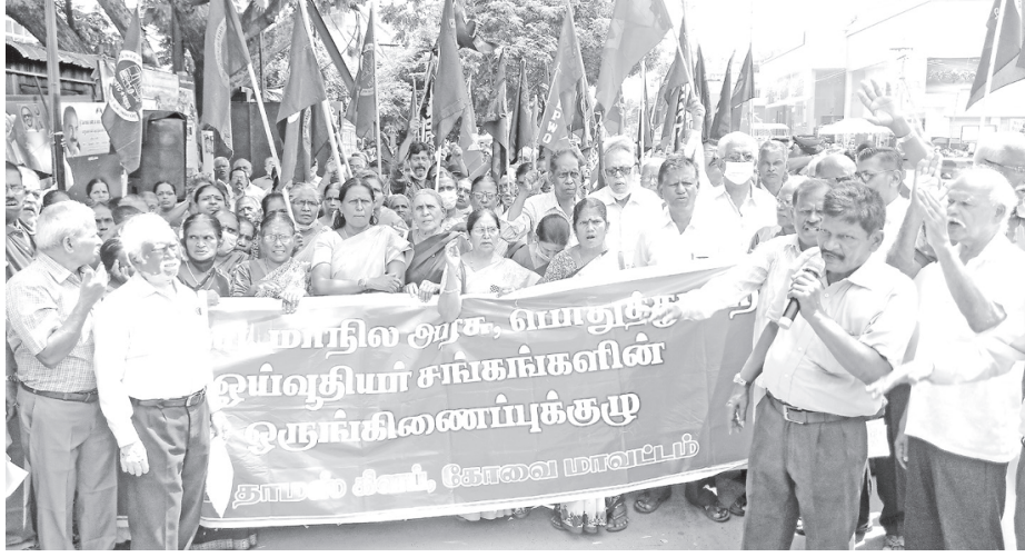
அரசு போக்குவரத்து கழக ஓய்வூதியர்களுக்கு வழங்கப்படாத ஓய்வூதிய உயர்வு மற்றும் அகவிலைபடிமை உடனே வழங்க கோரி மத்திய, மாநில பொது துறை ஓய்வூதியர் சங்கங்களின் ஒருங்கிணைப்பு குழுவினர் கோவை மேட்டுப்பாளையம் ரோட்டில் உள்ள மண்டல போக்குவரத்து கழக அலுவலகம் முன் இன்று கண்டன ஆர்ப்பாட்டம் செய்தனர்.

இது தொடர்பாக போலீசார் ஏமாற்றுதல், மோசடி உள்ளிட்ட பிரிவுகளின் கீழ் வழக்குப்பதிவு செய்து விசாரணை நடத்தி வருகின்றனர்.